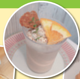
ミルクティープリン